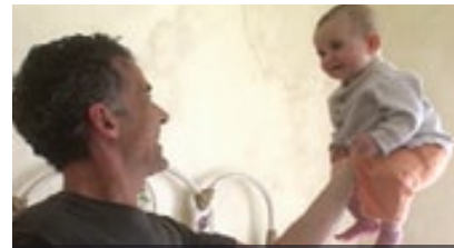
I USED TO BE A FILMMAKER