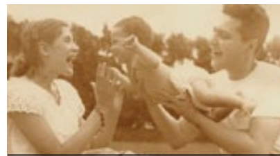
FOUR QUESTIONS FOR A RABBI