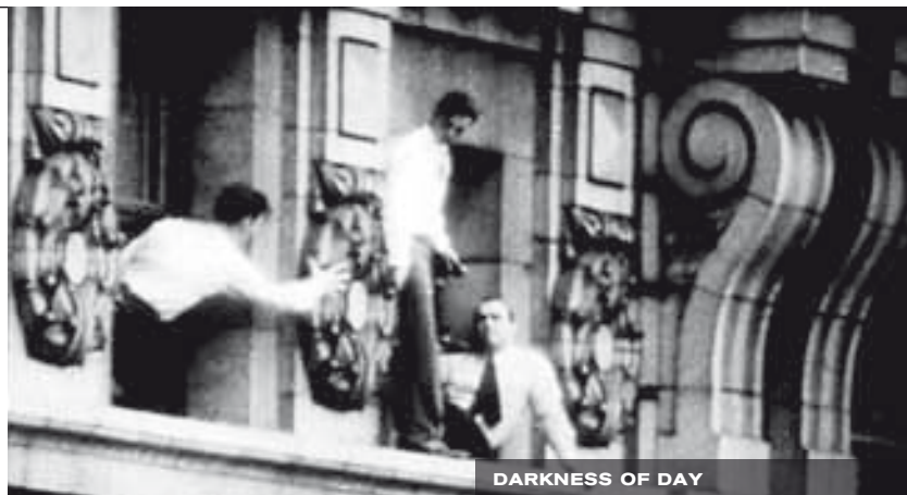
DARKNESS OF DAY