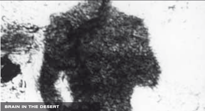
BRAIN IN THE DESERT

your films as being cultural criticism, not just because they make us reflect on previously filmed material but above all because they question our thought patterns and perceptions of the world; or rather, the world in which we have constructed our thought patterns and our image of the world through film.