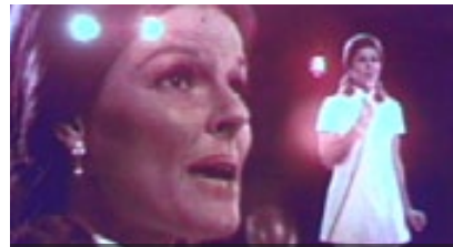
I JUST WANTED TO BE SOMEBODY