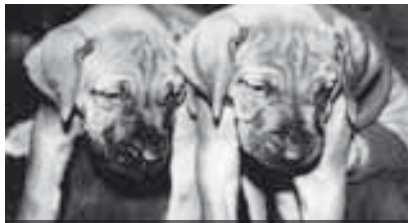
A PREGNANT MOMENT

Da hat es dann wirklich angefangen mit Found-Footage. Aber das war eigentlich ein Zufall. Wie schon erwähnt, gab es da diese Optische Bank und ich konnte damit arbeiten. Mir war ein kleines Stipendium bewilligt worden und ich hatte auch schon einen Vorschlag für einen Film. Aber nachdem ich eine Weile an dieser Idee gearbeitet hatte, merkte ich, dass sie mir nicht gefiel und nirgendwohin führte. Ein Jahr davor – leider ist diese