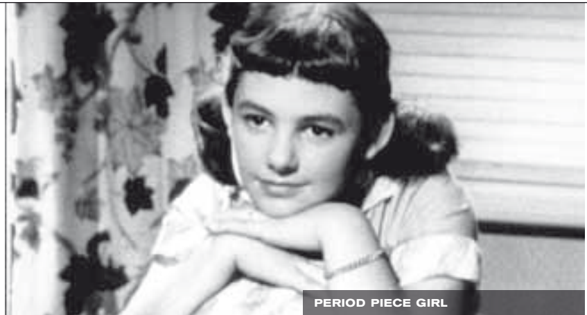
PERIOD PIECE GIRL

mythologique, devient ainsi un instrument du dire, une pratique de liberté et de dialectique, un instrument critique qui sert à reprendre le dialogue avec ce qui n'a jamais réussi à pénétrer le périmètre du photogramme déjà filmé. Et c'est ce non-vu, précisément, qui sommeille aux marges du périmètre du photogramme qu'il continue d'accompagner tel un