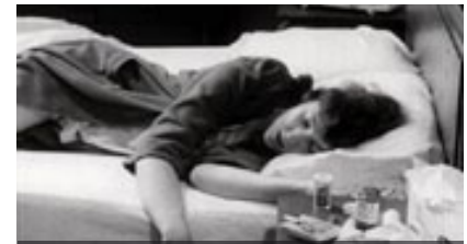
DARKNESS OF DAY