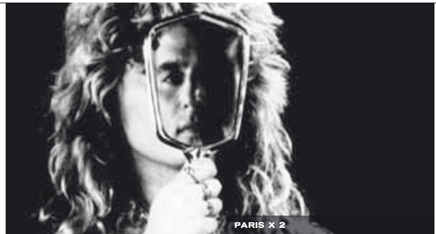
PARIS X 2

Guitar... De Johnny Guitar , j'ai tiré le dialogue entre Sterling Hayden et Joan Crawford, mais j'ai pris uniquement les paroles, pas les images. Il va de soi qu'inconsciemment, je suis influencé et touché par le travail de Nicholas Ray et j'aime quelques-uns des films d'Aldrich. Je suis convaincu que les choses que tu dis sont effectivement dans les films. Je ne pense pas que tu les imagines. Je crois qu'il y a une sorte de qualité baroque dans ces films, et Short of Breath est un film baroque. Short of Breath est un film délibérément mélodramatique de manière très prononcée. Il pousse le mélodrame sur un terrain extrêmement douloureux. Par exemple au début, avec cette femme qui pleure interminablement. Un dixième du film est consacré à cette femme qui pleure. On pourrait dire que le film est une accentuation à l'extrême de ce type d'émotivité que tu y décèles.