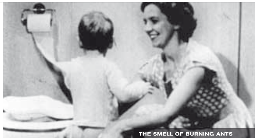
THE SMELL OF BURNING ANTS