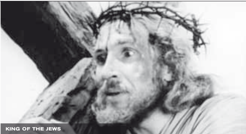
KING OF THE JEWS

Rosenblatt in The Smell of Burning Ants die Unterdrückung des Weiblichen durch männliche Gewalt. Ein noch finsternes Echo dieser Gewalt findet sich in Humans Remains , einer kühlen Autopsie von fünf Diktatoren, die das plutarchsche Schema der Lebensbeschreibungen berühmter Männer umdreht. Restricted hingegen verkehrt die US-amerikanische Ideologie der Chancengleichheit in ihr Gegenteil, während Prayer , eine Antwort auf die Angstkampagne der Bush-Regierung nach 9/11, einen Versuch darstellt, einen Blick jenseits der Ideologien zu werfen. Die Verbindung zwischen zwei weit entfernten Bildern wird zu einem Zeichen potenzieller Solidarität, wie King of the Jews unwiderlegbar aufzeigt. Rosenblatt nimmt hier ein Jesus-Triptychon zum Anlass, über die kulturelle Enteignung der Figur Christus auf Kosten der Juden nachzudenken und legt darüber hinaus den Grundstein für eine neue Art der Reflexion, die diese Figur weniger unter dem Gesichtspunkt der Exklusion als dem der Inklusion zu verstehen sucht. So wird der Filmschnitt für Rosenblatt zu einem Ort möglicher Begegnung.