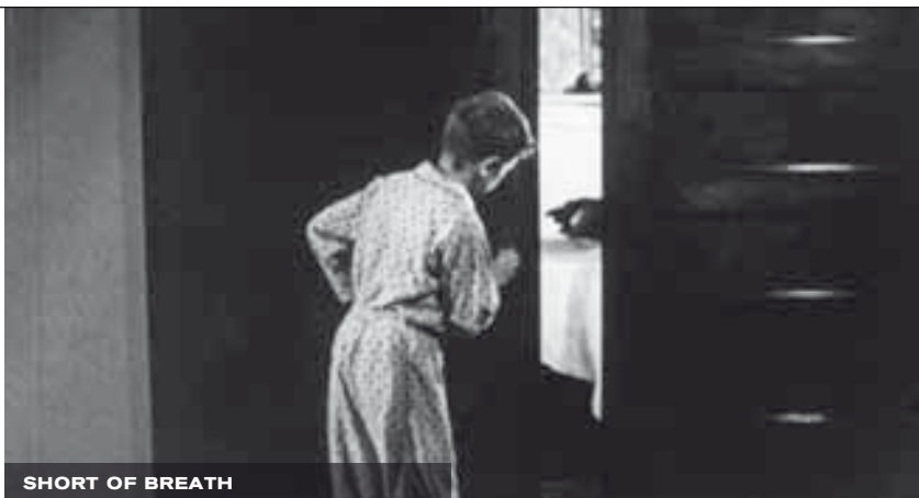
SHORT OF BREATH

Geschichte ein wenig verworren – hatte ich in der Nähe des Krankenhauses, wo ich arbeitete, in einem Müllcontainer 16mm-Filme gefunden. Irgendjemand hatte sie weggeworfen; ich hatte keinen blassen Schimmer, was das für Filme waren. Ich habe sie aus dem Müll gezogen und ins Auto gelegt. Da lagen sie dann erst einmal ein Weile, bevor ich mir das Material näher angeschaut habe. Das heisst, ich wusste überhaupt nicht, worum es sich handelt. Ich hatte also dieses Stipendium und eine Idee, die mir nicht mehr gefiel. Ich dachte: Was mache ich jetzt für einen Film, und vor allem, über was? Irgendwann habe ich beschlossen, mir diese Filmrollen anzusehen. Und was waren es für Filme? Trainingsfilme für Ärzte. Es ging um das richtige Benehmen am Krankenbett. Wie man mit Patienten spricht. Ich war begeistert von dem Material. Ich habe es sofort als Struktur gesehen; ich wusste, wie ich dieses aufgefundene Filmmaterial verwenden